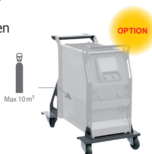
Chariot ref. 040960