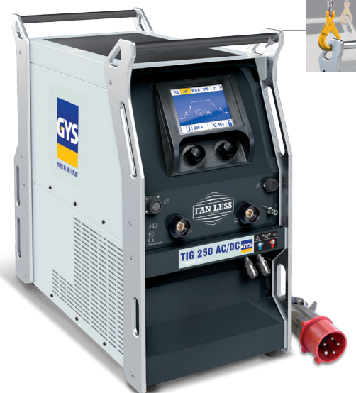
Livré sans accessoires

Mode Easy ou mode PRO pour un accès complet des paramétrages.